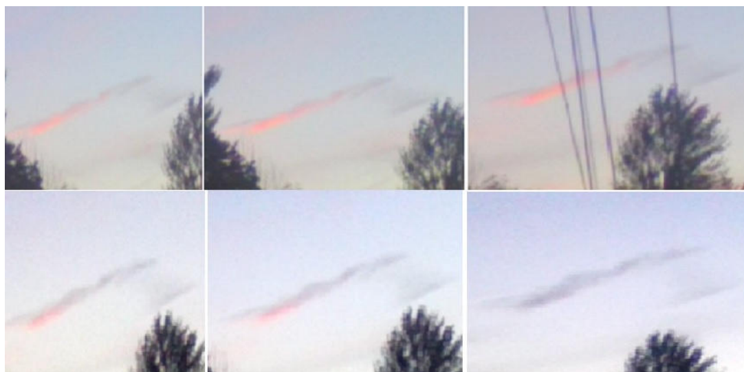
Рис. 2. Изменение формы болидного следа над Киевской областью 8 июля 2016 года. Изображения получены Дашкиевым Г.Н. в моменты времени UT 19:27:46, 19:27:57, 19:28:28, 19:29:23, 19:29:28, 19:31:59.